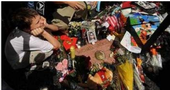
DECES DE MICKAEL JACKSON / Les fans se préparent à... 1/10